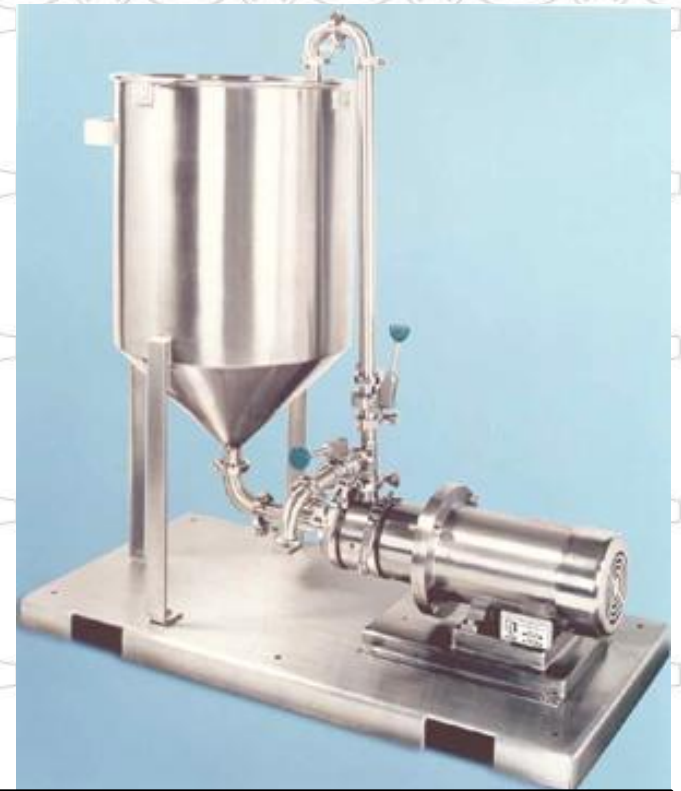
MODELO EN LINEA SANITARIO