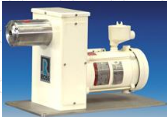
MODELO DE LABORATORIO

VENDE y DISTRIBUYE EN ARGENTINA : TRADEFIN S.A. Tucumán 811 Piso 3° - 1049 - CABA - Bs As - Argentina Tel: 4326 - 0915 - Mail: info@tradefin.com.ar