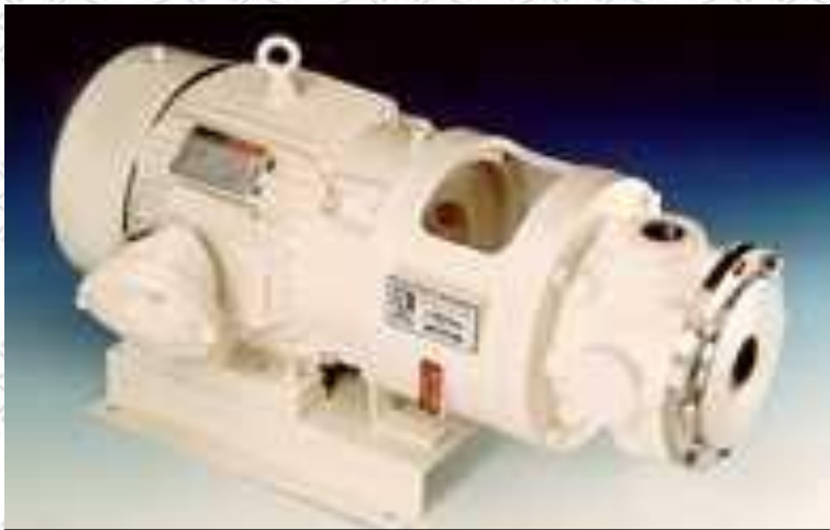
MODELO EN LINEA